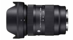
28-70mm F2.8 DG DN | Contemporary

φ72mmのフロントフィルターが装着可能。超広角撮影で多用されるPLフィルターやNDフィルターなどがより使いやすくなります。AFアクチュエータにはステッピングモーターを採用。俊敏で静粛なAFは、静止画はもちろん動画撮影にも最適です。焦点距離を変えても全長が変わらずほとんど重心移動がないことから、安定性や機動性が求められる手持ち撮影、ジンバルでの撮影、Vlog撮影などで強みを発揮します。インナーズームは、全長100.6mm、最大径77.2mm、質量わずか450g*という、もはやF4クラス並のサイズの小型化にも寄与しています。同じ「F2.8ズームシリーズ」28-70mm F2.8 DG DN | Contemporaryと組み合わせると、超広角から中望遠までカバーできて総質量わずか920gの極めてコンパクトなシステムを組むことができます。